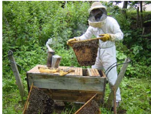
Professionelles Imkern als Beitrag zum Waldschutz